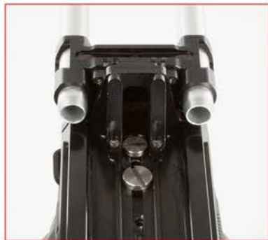
BOTTOM VIEW / VU DU DESSOUS