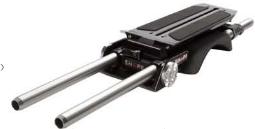
FINAL RESULT / RÉSULTAT FINAL

SHAPE RESERVES THE RIGHT TO USE ANY PHOTOS INCLUDING SHAPE PRODUCTS FOR MARKETING PURPOSES