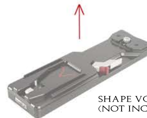
SHAPE VCT TRIPOD PLATE (NOT INCLUDED / NON INCLUSE)