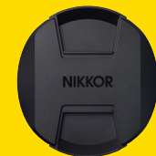
VORDERER OBJEKTIVDECKEL LC-K104