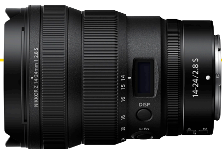
NIKKOR Z 14-24 mm 1:2,8 S