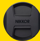
VORDERER OBJEKTIVDECKEL LC-Z1424