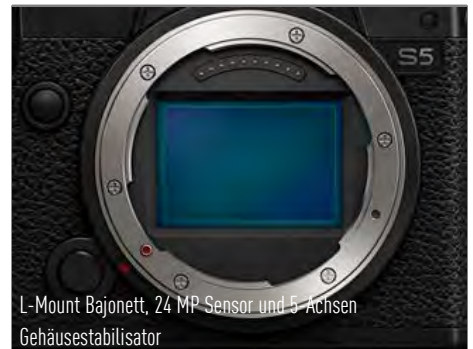
L-Mount Bajonett, 24 MP Sensor und 5-Achsen Gehäusestabilisator

Der verbesserte Autofokus nutzt Deep-Learning-Technologie zur Erkennung von Augen, Kopf und Körper für deutlich schnelleres und präziseres Fokussieren bei Foto- und Filmaufnahmen. Professionelle Videoaufnahmen sind durch max. 4K 60p 4:2:2 10 Bit mit 14+ Blenden Dynamik in Vlog, HDR, Zeitlupe & -raffer sowie diversen Audiolösungen realisierbar. Zuletzt garantiert das L-Mount Bajonett und die Allianz mit Leica und Sigma Zukunftssicherheit und schnellen Objektivausbau.