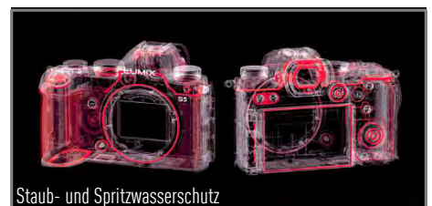
Staub- und Spritzwasserschutz

Bildqualität – 24 MP Sensor ohne Tiefpassfilter, 96 MP HighRes-Shot