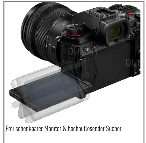
Frei schenkbare Monitor & hochauflösender Sucher

Die LUMIX S5 verbindet Foto und Video in Perfektion. Zusammen mit dem neuen Autofokus, dem robusten Magnesiumgehäuse und nicht zuletzt der Kompaktheit macht sie das zum idealen Begleiter für Fotografen und Videografen, die keine Kompromisse wollen. Der 24 MP Vollformatsensor sorgt für großen Dynamikumfang und sehr rauscharme Bildqualität durch Dual Native-ISO Technologie. Noch höhere Auflösungen sind mit dem High Resolution Modus möglich, der detailreiche Aufnahmen mit 96 MP in RAW oder JPG erstellt. Ein weiteres Highlight bietet die interne 5-Achsen-Bildstabilisierung, die in Verbindung mit Objektiv-Stabilisierung eine um bis zu 6,5 Blendenstufen längere Belichtungszeit ohne Verwackelungsunschärfe ermöglicht.