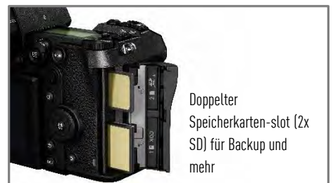
Doppelter Speicherkarten-slot (2x SD) für Backup und mehr